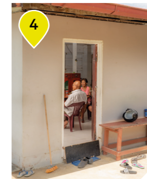
Grounding - Stories of Migration, FOTODOK x BredaPhoto