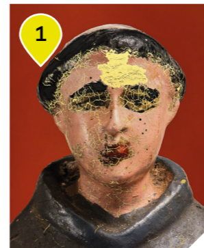
ENCOUNTERS | ENCONTROS, Rosângela Rennó